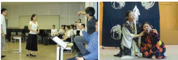
● 授業・試演会風景