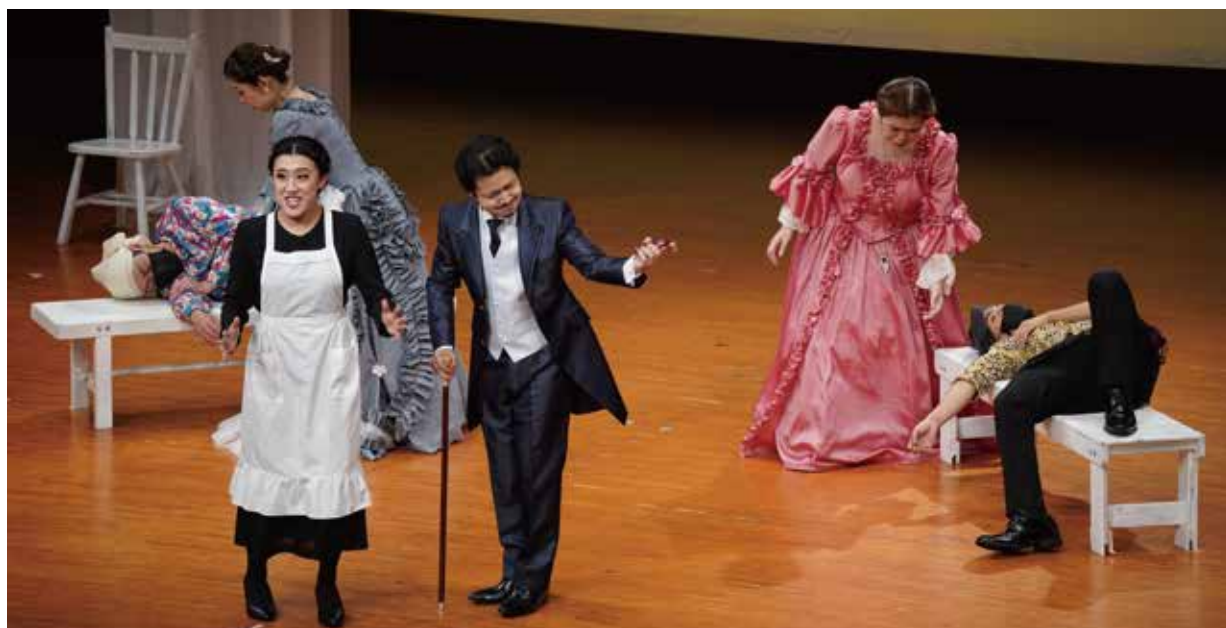
58期本科生修了公演「コジ・ファン・トゥッテ」より