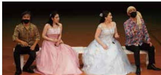
● 研修所修了オペラ公演